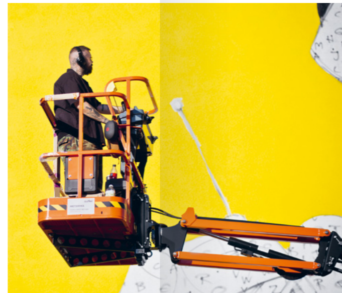
Das erste Mural schuf der Künstler HOMBRE 2023 auf rund 13 x 13 Metern.

Der Kulturverein ist weiter auf der Suche nach geeigneten Fassaden. Über Tipps freut sich Markus Christl unter www.kuttercrew.de