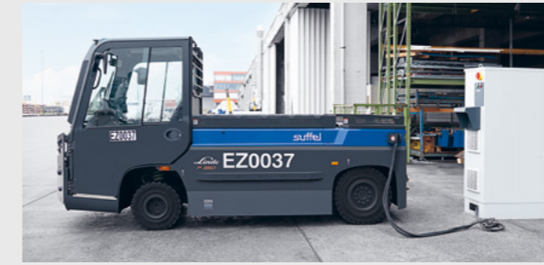
Das Outdoor-Gehäuse der Linde-Energy-Case-Ladesäule ist nach IP54-Prüfnorm spritzwassergeschützt und hält jeder Wetterbedingung stand.

„Der Wechsel auf Lithium-Ionen-Technologie bei hohen Zuglasten ist für FCS ein weiterer Schritt in Richtung Klimaneutralität.“