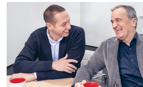
Privat wie beruflich ein gut eingespieltes Team.

die Suffel Belegschaft, die sich all die Jahre überdurchschnittlich engagiert und dem Suffel Spirit ein Gesicht gegeben hat. Danke an alle für den gemeinsamen Weg!