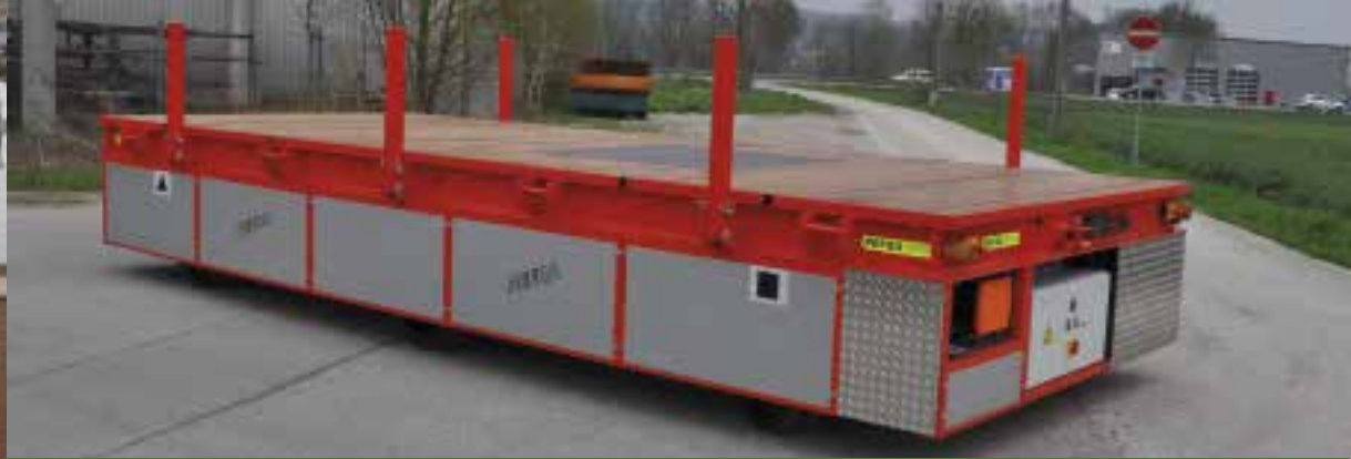
EGW: 20 t, Transport Stahlrohre (bis 18m)