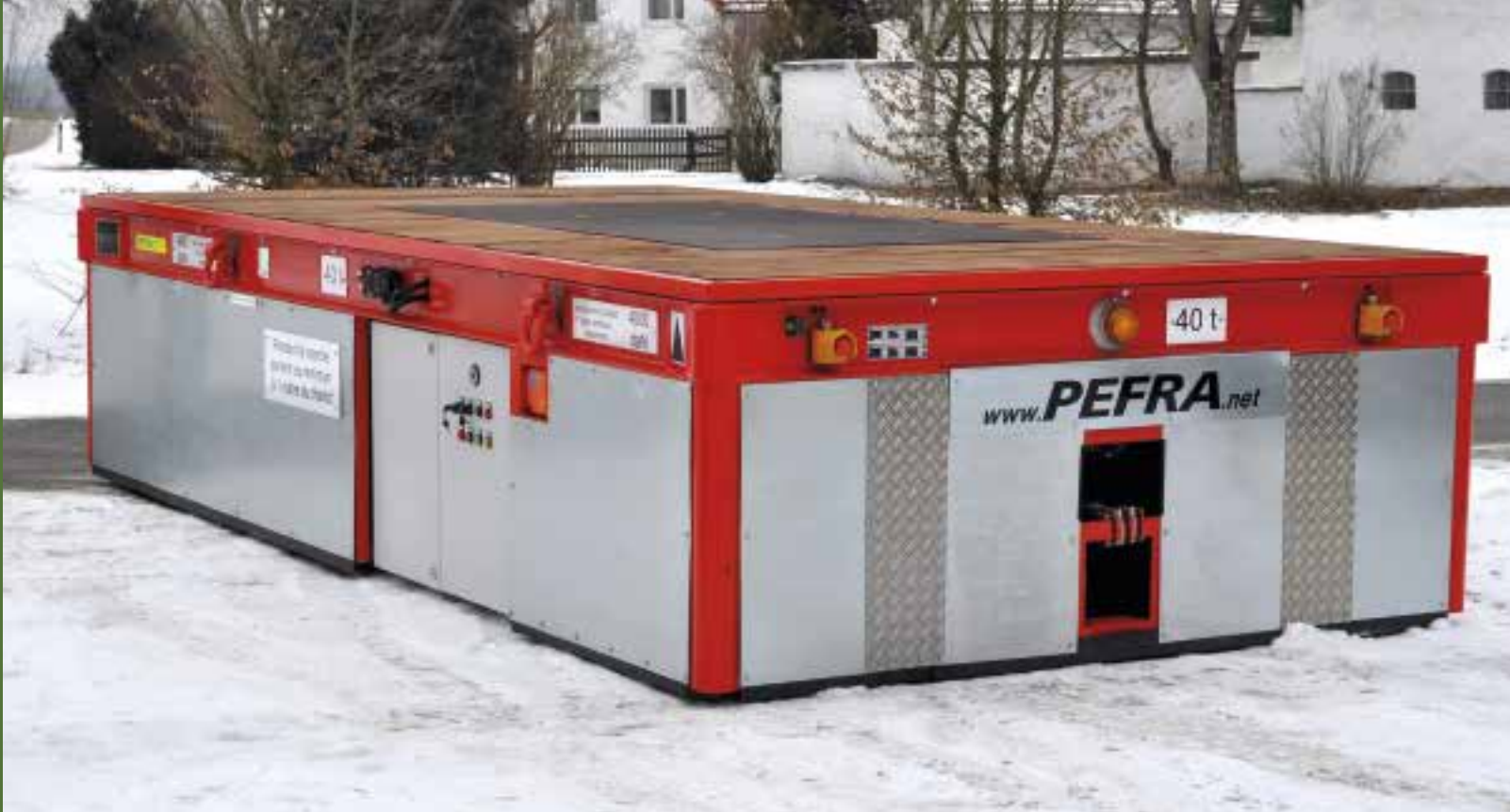
EGW: 40 t, Transport Werkzeuge.