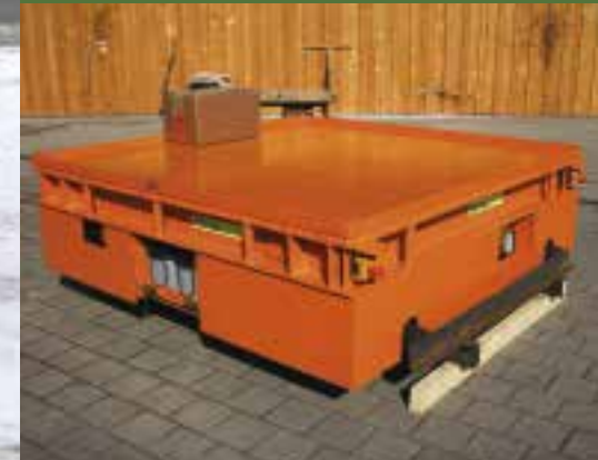
ESW: 20 t, Transport Stahlguss.