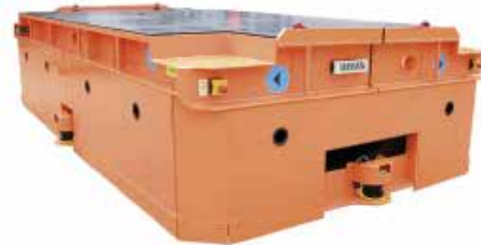
Bezeichnung: FTS Nutzl./Geschw.: 56 t/2 km/h Antrieb: 20KW 80V