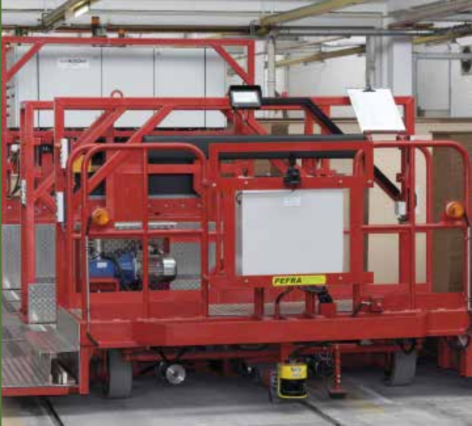
EFW: 15 t, Transport Möbelteile