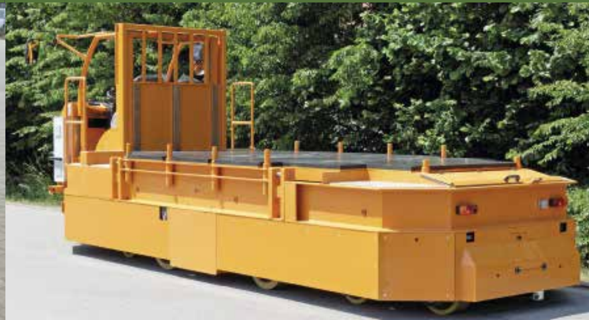
EFW: 56 t, Transport Presswerkzeuge.