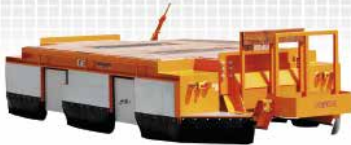
Bezeichnung: EFW Nutzl./Geschw.: 57 t/4 km/h