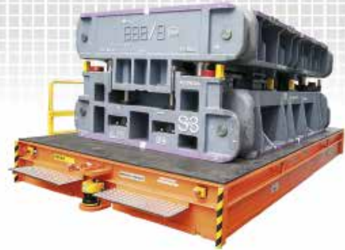
Bezeichnung: ESW Nutzl./Geschw.: 56 t/4 km/h