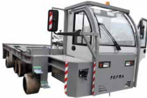
Bezeichnung: EFW Nutzl./Geschw.: 60 t/12 km/h Antrieb: 40KW 80V