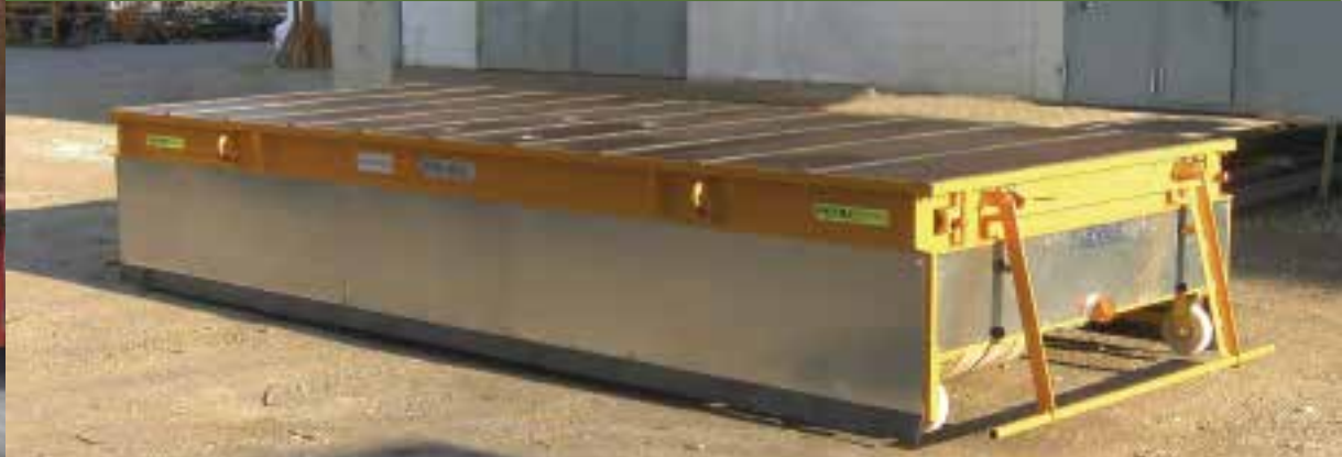
EGW: 35 t, Transport Werkzeuge