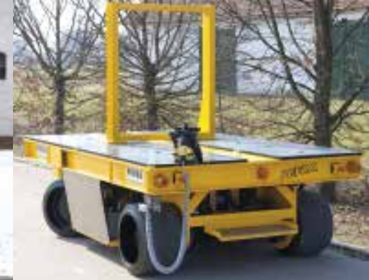
EGW: 20 t, Transport Werkzeuge.